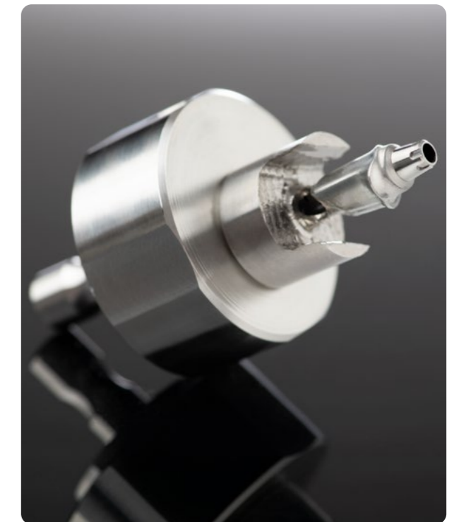
vhf propose également un choix impressionnant de porte-piliers pour tous les systèmes courants.